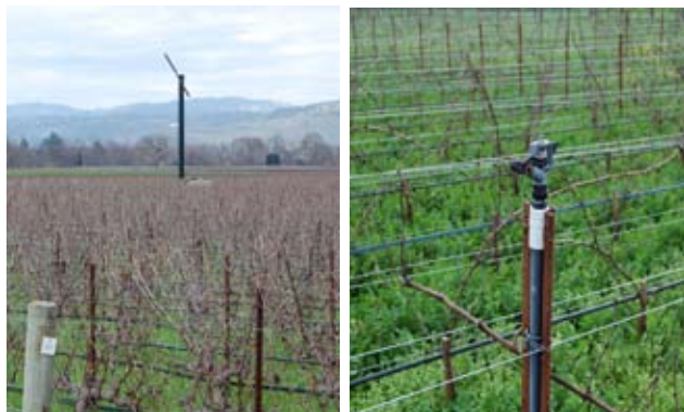
Lutte contre le gel de printemps chez Opus One : à gauche par brassage d'air (une hélice protège 4 ha) et à droite par aspersion

Le climat de la Napa Valley est un climat de type méditerranéen. Le nord, abrité et protégé par les montagnes, profite d'un climat chaud. Le sud de la vallée est plus frais en raison de la proximité de la baie de San Pablo. Les températures s'élèvent pendant la phase de maturation des raisins et peuvent atteindre les 40°C. Chez Opus One par exemple, dès que la température dépasse 38-39°C, un système d'aspersion est mis en place pour protéger les fruits et faire chuter la température. Autre particularité, le vignoble est couvert par un intense brouillard durant les matins d'été qui s'estompe vers 11h en général. Le gel printanier est un problème puisqu'il existe 10 à 20 nuits de gel par an. Les moyens de lutte les plus utilisés sont l'aspersion et le brassage d'air par des hélices. La pluviométrie est d'environ 700 à 800 mm/an avec une répartition très irrégulière car il ne pleut pas de mai à octobre.