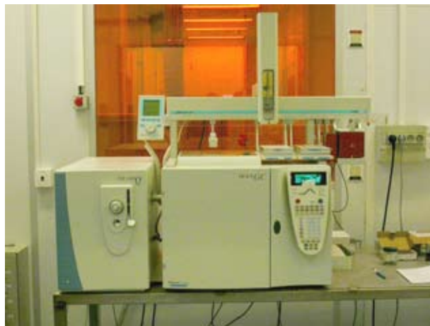
CPG/SM utilisé pour réaliser les analyses fines. Les dosages ont été réalisés par Nyseos (Montpellier)

Ces analyses font également apparaître des concentrations en composés fermentaires et en beta-damascénone cohérentes et dans la même plage de valeur que celles rencontrées pour la plupart des vins rouges.