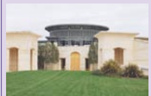
La pyramide Opus One à Oakville

Quelques unes des plus belles wineries visitées au cours de ce déplacement :