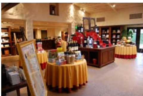
L'incontournable boutique chez Mondavi. Le Domaine ne cesse d'innover et de créer des événements autour du vin

Cette foule de visiteurs se deversant sur le domaine, essentiellement en été, impose une logistique bien rodée. Le domaine est ouvert presque toute l'année (4 jours de fermeture/an) et des départs de visite ont lieu toutes les 15 minutes en été. Alors que le domaine emploie 30 à 50 personnes en production, les visites et l'aspect œnologique