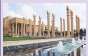
Le Persépolis de Dariusch winery à Napa