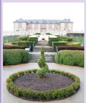
Réplique d'un chateau champenois au Domaine Carneros