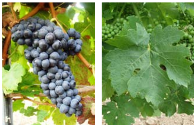
Grappe et feuilles de Durif (clone 1130)

Des analyses ADN ont montré qu'il était le résultat du croisement spontané des cépages Peloursin, (cépage noir originaire de la vallée de l'Isère et pratiquement disparu aujourd'hui) et de la Syrah.